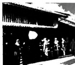
訓練の様子（令和5年1月 文化財防火デー）